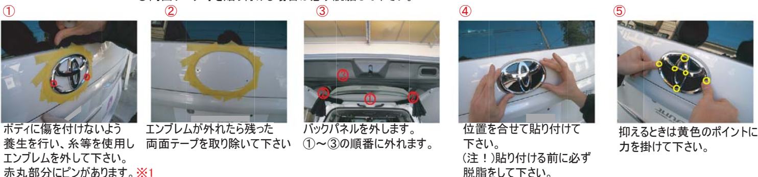
① ボディに傷を付けないよう養生を行い、糸等を使用しエンブレムを外して下さい。赤丸部分にピンがあります。※1 ② エンブレムが外れたら残った両面テープを取り除いて下さい ③ バックパネルを外します。①～③の順番に外れます。 ④ 位置を合せて貼り付けて下さい。(注!)貼り付ける前に必ず脱脂をして下さい。 ⑤ 抑えるときは黄色のポイントに力を掛けて下さい。

光度計測定の結果保安基準適合 (光度 300cd 未満を満たす) ※尚、説明書記載以外の取り付け を行った場合(点滅、加工等)は 車検に対応しなくなります。 また、陸運局にて保安基準適合の確認を 行っておりますが地域によっては検査官 の主観が異なる事がありますので、 事前にご確認下さい。