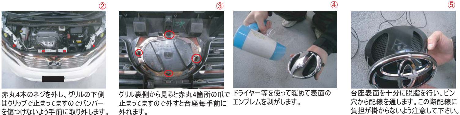
② 赤丸4本のネジを外し、グリルの下側はクリップで止まっていますのでバンパーを傷つけないよう手前に取り外します。 ③ グリル裏側から見ると赤丸4箇所を爪で止まっていますので外すと台座毎手前に外れます。 ④ ドライヤー等を使って暖めて表面のエンブレムを剥がします。 ⑤ 台座表面を十分に脱脂を行い、ピン穴から配線を通します。この際配線に負担が掛からないよう注意して下さい。