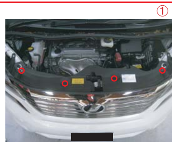
① ラジエーターフードの4か所のクリップを取り外します。